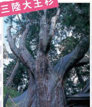
一説によると樹齢7000年以上とも言われる大木