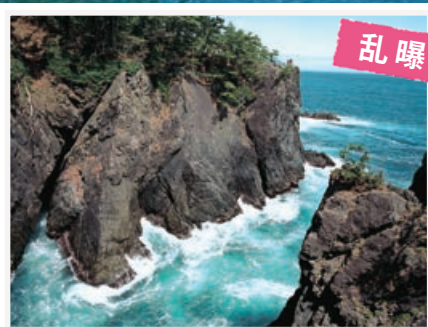
高さ約30m。気分は火曜サスペンス！