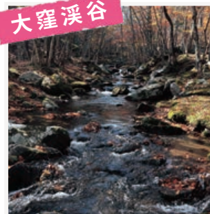
若葉・新緑・紅葉…四季を楽しむ。

風光明媚なりアス海岸に位置し海のイメージが強い大船渡市ですが、四季折々の表情をもった山々や溪谷にも囲まれています。若葉、新緑、紅葉と季節を肌で感じることができます。海と山の景観を同時に味わえる贅沢なひとときをお過ごしください。