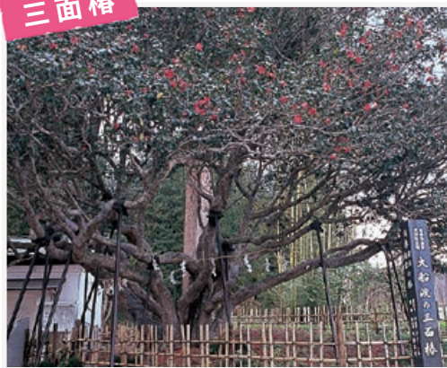
日本最大級にして最古。樹齢はなんと…

末崎町の熊野神社境内の三面椿は日本最大級にして最古のヤブツバキ。樹齢1400年以上といわれ社殿の東、西、南の三面に植えられましたが、現在は東の椿が残っています。