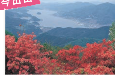
大船渡湾を望むツツジの名所。