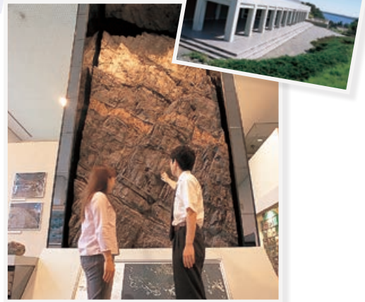
大地の歴史と人と海と…