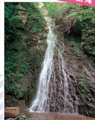
「岩手の名水二十選」