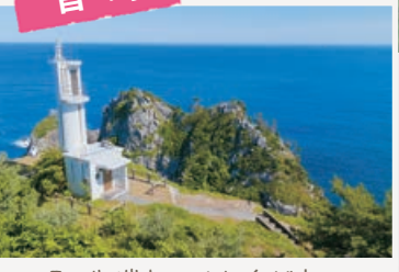
山の先端部にはXT台があり、 ここから眺める岬の連なりは絶景です！