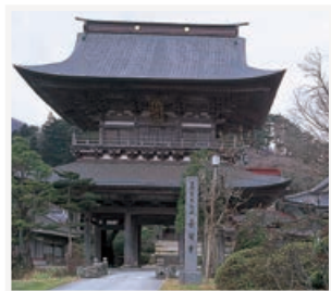
歴史ある山門は圧巻