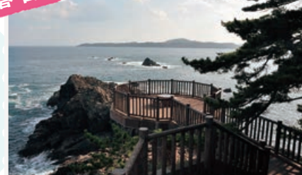
眼前の大海原にすべてを忘れる瞬間