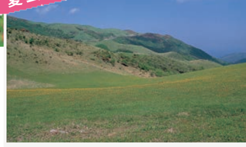
山頂まで車でドライブ！ ホンシュウジカに高確率で遭遇