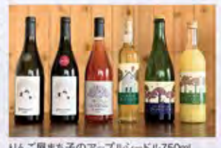
りんご屋まち子のアップルシードル750ml REGALO-CALTA(ワイン)750ml

2018年、市内中心部にワイナリーが完成し、自社でのシードル・ワイン造りをスタート。小さなワイナリーだからこそ、丁寧にこだわりある物づくりを目指しています。海の風を受けて育ったぶどうやりんごを、三陸の海の幸に合うように、スキットとした辛口に仕上げています。"やさしい気持ちになれる"乾杯シードル・ワインで、大切なご家族やご友人たちと、素敵なひとときを過ごして頂けるようにご提案しています。