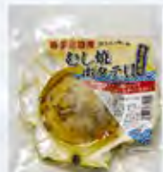
むし焼はたて貝[3D急速冷凍](12cm以上)