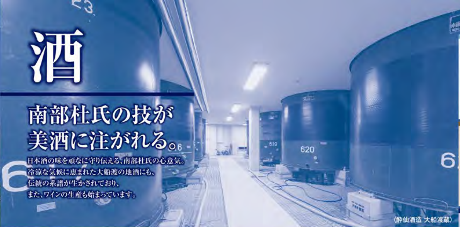
〈酔仙酒造 大船渡蔵〉