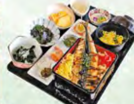
さんま重 (1,430円) 大船渡さんまら〜めん (850円)