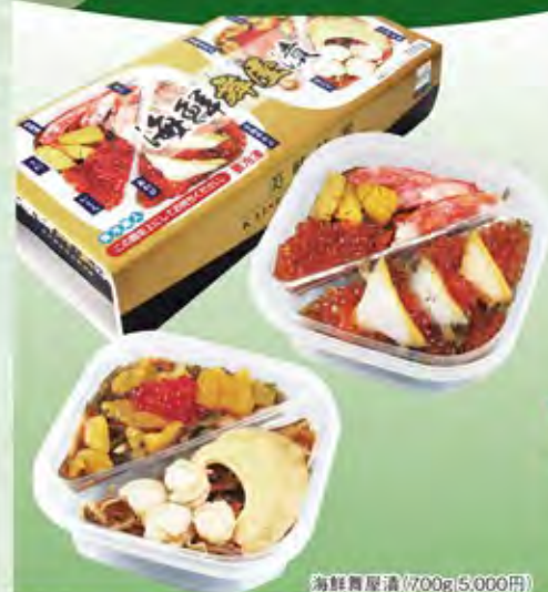
海鮮舞屋漬 (700g 5,000円)