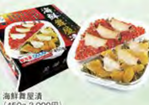
海鮮舞屋漬 (450g 3,000円)