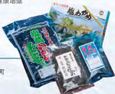
おおふなとわかめ100g 早煮こんぶ