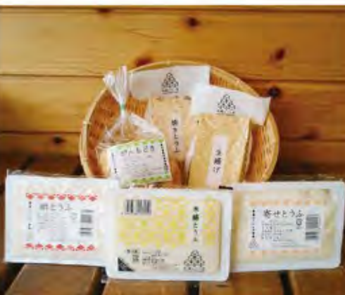
木綿とうふ(400g 200円)、寄せとうふ(400g 200円)、がんもどき(5ヶ入 300円)、絹とうふ(30g 200円)、焼きとうふ(1枚入 200円)、生揚げ(1枚入 200円)

代表者名/佐々木 義行 住所/岩手県大船渡市盛町字内/目6-5 TEL/0192-26-5328 FAX/0192-26-5328 営業時間/8:00~19:00 (定休日:日曜日)