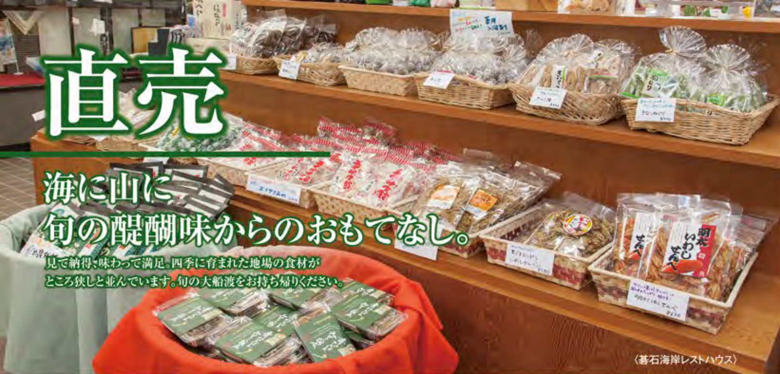
(碓石海岸レストハウス)

見て納得、味わって満足。四季に育まれた地場の食材が、 ところ狹しと並んでいます。旬の大船渡をお持ち帰りください。