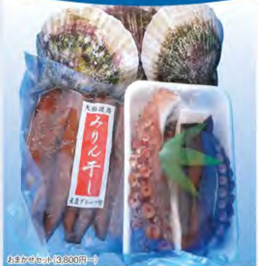
おまかせセット(3,800円~)