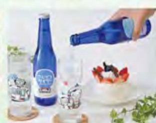
さんてつサイダー (330ml 300円) 走る列車型キーホルダー (650円) 列車型目覚まし時計 (1,650円)