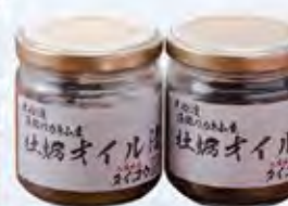
カキコンオイル漬け(170g) 1,080円

【市内】三陸おさかなファクトリー 【県内】一関市:大町新鮮館 奥州市:Zプラザアテルイ