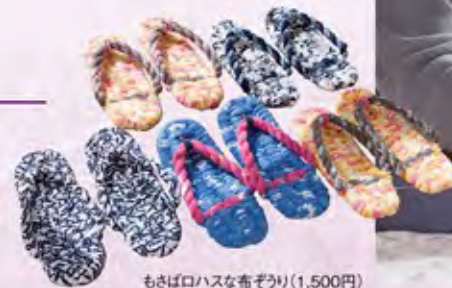
もさばロハスな布ぞうり(1,500円)