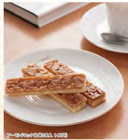
アーモンドロック(約2人分 140円)