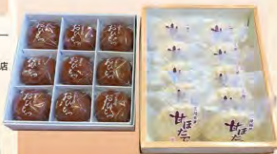
三陸銘菓「甘ぼたて」(10ヶ入 1,836円) 大船渡名物「おひとつ」(9ヶ入 1,180円)

代表者名/高橋 靖定 住所/岩手県大船渡市大船渡町字野々田12-33 キャッセンモール&パティオ内 TEL/0192-27-1170 FAX/0192-27-1170 営業時間/9:00~18:00(水曜日定休)