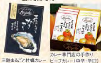
三陸まるごと牡蠣カレー(180g/食 864円) カレー専門店の手作りビーフカレー(中辛・辛口)(180g/食 648円)