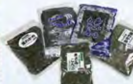
碁石わかめ(800g)、生こんぶ(800g)、茎わかめ(800g)、茎わかめ 剣山(800g)、きざみ昆布(200g)

碁石わかめ、生こんぶ、茎わかめ、茎わかめ 剣山、きざみ昆布、わかめ こんぶ 詰め合わせ