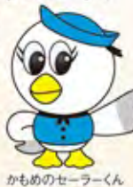
かもめのセーラーくん

「かもめの玉子」でおなじみの「さいとう製菓」の総本店「かもめテラス」。4つの自社ブランドを構え、旗艦店としてカフェスペースをはじめ、キッズスペースや実演販売、さらにチョココーティング前の焼き玉子に思い思いのトッピングを施すことで、自分だけのかもめの玉子が作れる「DECOかもめの玉子体験」も大人気。他にも、黄味餡をモンブラン風に見立てたオリジナルソフトクリーム「かもめソフト」もファン急増中! 「齊藤餅屋」こだわりのだんごもオススメ!