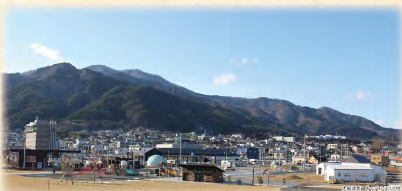
大船渡町-壺屋田耕