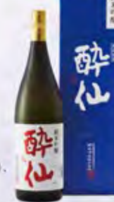
純米吟醸 酔仙 (1,800ml 3,850円)、 純米吟醸 酔仙 (720ml 1,925円)