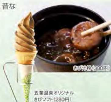
五葉温泉オリジナルきびソフト (280円)

五葉温泉オリジナルきびソフトクリーム、甘さ控えめできびの味がします、食感はさらさらした感じでヘルシーな逸品です。