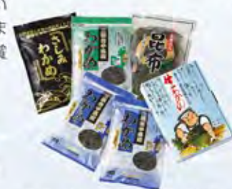
さしみわかめ(300g)、袋入りわかめ(300g)、 ポイル塩蔵こんぶ(500g)、 さんま 化粧箱入わかめ(400g×2入)