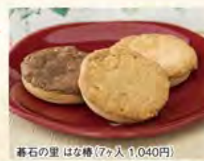
碁石の里 はな椿(7ヶ入 1,040円)

代表者名/田村 耕一 住所/岩手県大船渡市猪川町字前田1-5 TEL/0192-26-2289 FAX/0192-27-3055 営業時間/8:30~18:00 田村 孝文