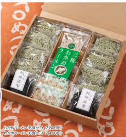
わかめラーメン(8食セット) 2,800円 わかめラーメン(6食セット) 2,100円

代表者名/所長 笠井 政利 住所/岩手県大船渡市赤崎町字沢田101 TEL/080-2821-3053 FAX/0192-47-3690 営業時間/8:00~17:00