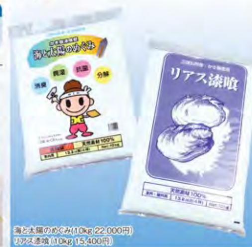
海と太陽のめぐみ(10kg) 22,000円 リアス漆喰(10kg) 15,400円

代表者名 / 代表取締役 菊池 透 住所 / 岩手県大船渡市赤崎町 字石橋前11-3 TEL / 0192-47-3748 FAX / 0192-47-5559 営業時間 / 8:00~17:30 http://www.k-giken.co.jp/ 菊池 透