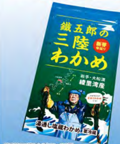
鐵五郎の三陸わかめ(100g 380円)