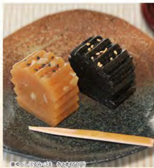
壺ゆべし(くろみかき) 各1ヶ550円