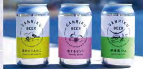
週末のうみねこ(350ml 594円)、恋するセゾン(350ml 594円)