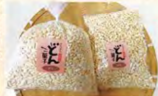
米どん 70g (120円) 米どん 200g (220円)

昔ながらの米どん菓子や水飴を用いて固めた米おこしを中心にお米以外にもくるみやアーモンドなどバリエーションを増やして日々心を込めて商品を作り続けております。小さなお子様からご年配の方まで、食べやすく好まれる優しい味わいのどん菓子やぜひご賞味ください。