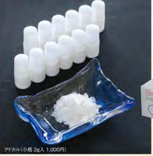
アドカル(小瓶 2g入 1,000円)