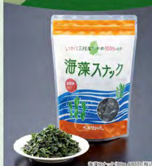
海藻スナック (20g 480円(税別))