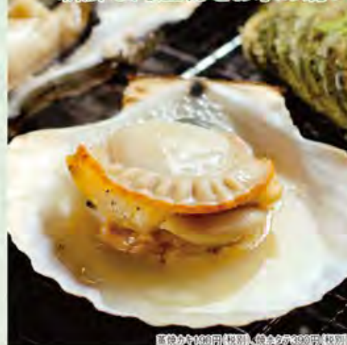
殻付き小判貝 (1個) 税別、焼きそば (300円) 税別