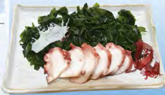
わかめとたこ[3D急速冷凍](わかめ70g たこ30g)