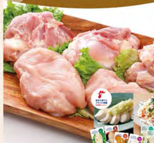
サラダチキン(100g)、 ほぐせるサラダチキン(90g)