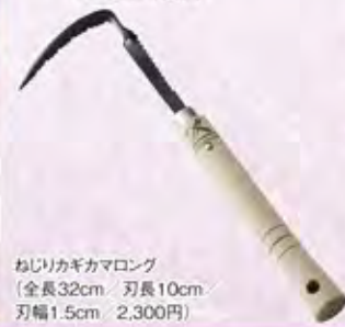
ねじりカギカマロン (全長32cm、刃長10cm、刃幅1.5cm、2,300円)

熊谷鍛冶屋の鎌シリーズは、折れず曲がらず、オリジナルの波刃と土に刺さりやすいように設計された独特な刃で、草を根こそぎ取ることができます。今回ご紹介するのは、それらの鎌の進化系である【ねじりカギカマロン】です。一番力が入る部分にねじり加工を加えることで、手や腕への負担を軽減します。サイドの波刃カッターは、草刈り鎌の役目をする為、長い草を短くカットしながら、草取りが出来るので作業が捗ります。