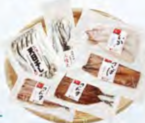
天日干しセット 6種 4,990円

代表者名/代表取締役 及川 廣章 住所/岩手県大船渡市大船渡町字中港3-100 TEL/0120-309-308 FAX/0192-26-4001 営業時間/8:00~17:00 http://oikawaya.co.jp/ (ホームページ) https://www.rakuten.ne.jp/gold/oikawaya/ (楽天市場店)