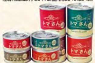
トマさんソース(大)各種 300g 648円(税込) トマさんソース(小)各種 110g 421円(税込)

取扱店 【市内】サンリア物産館、ジョイス大船渡店、マイヤ大船渡店、道の駅さんりく、三陸おさかなファクトリー、マルイチ大船渡店、大船渡温泉 ほか 【県内】川徳、賢治の土各店、イオン各店、かまい特産店、北上江釣子SC-PAL、盛岡南SC-NACS ほか