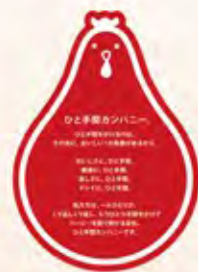
コーポレートキャラクターの「ブドリー」