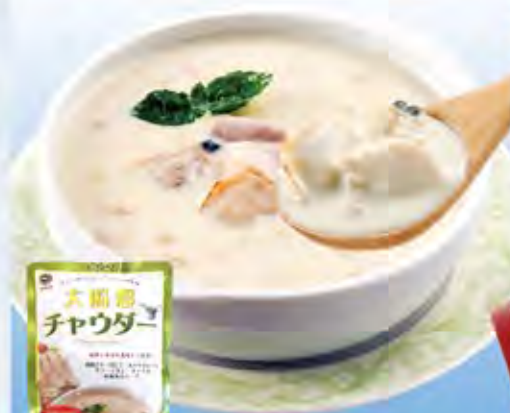
大船渡チャウダー 200g (2~3人前)