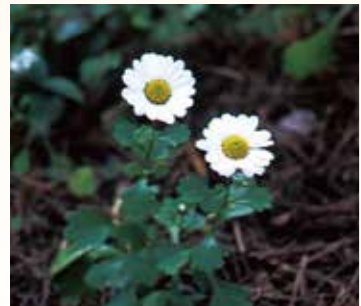
↑コハマギク(9月～11月が見頃)