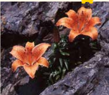
↑スカシユリ(7月～8月が見頃)