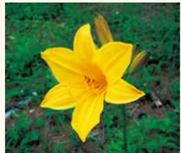
↑ニッコウキスゲ(6月が見頃)