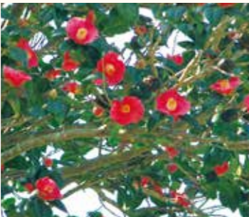
↑ヤブツバキ(12月～5月が見頃)